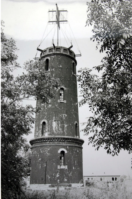
Der Leuchtturm Solthörn. Er wurde 1905 errichtet und ließ 1906 zum ersten Mal sein Licht erstrahlen.

Im Zuge der Fahrwasserbegradigung 1923/24 wurden die Feuer der Türme im Wurster Watt und Solthörn nach und nach gelöscht.