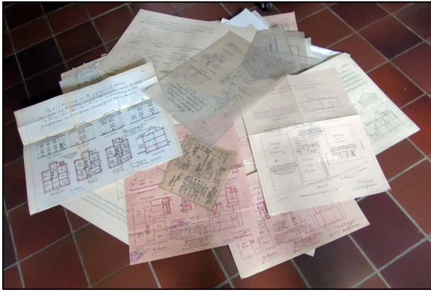
Der Stapel mit den Plänen der Wremer Häuser