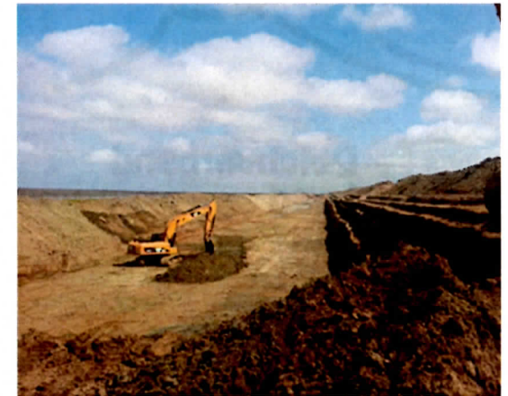
Abtreppen des Deichkörpers, Einbau des Sandkörpers, anschl. Wiederverfüllung

Für die Radfahrer wird die bestehende Umleitung über den Altdieich auch in 2015 und 2016 aufrechterhalten.