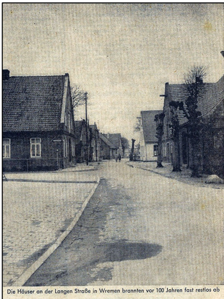
Lange Straße von Hainkhörnstraße aus gesehen Richtung Norden: Die Häuser an der „Langen Straße“ in Wremen brannten vor 100 Jahren fast restlos ab