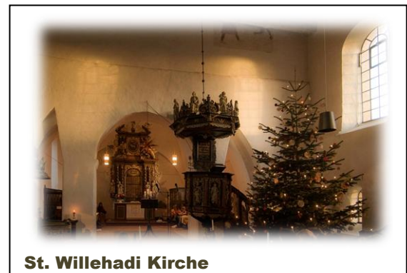
St. Willehadi Kirche

11:00 Uhr Vogelkundliche Führung mit Deichspaziergang Anmeldung: 0 47 05 / 2 10 oder 0 47 41 / 9 60 – 2 90